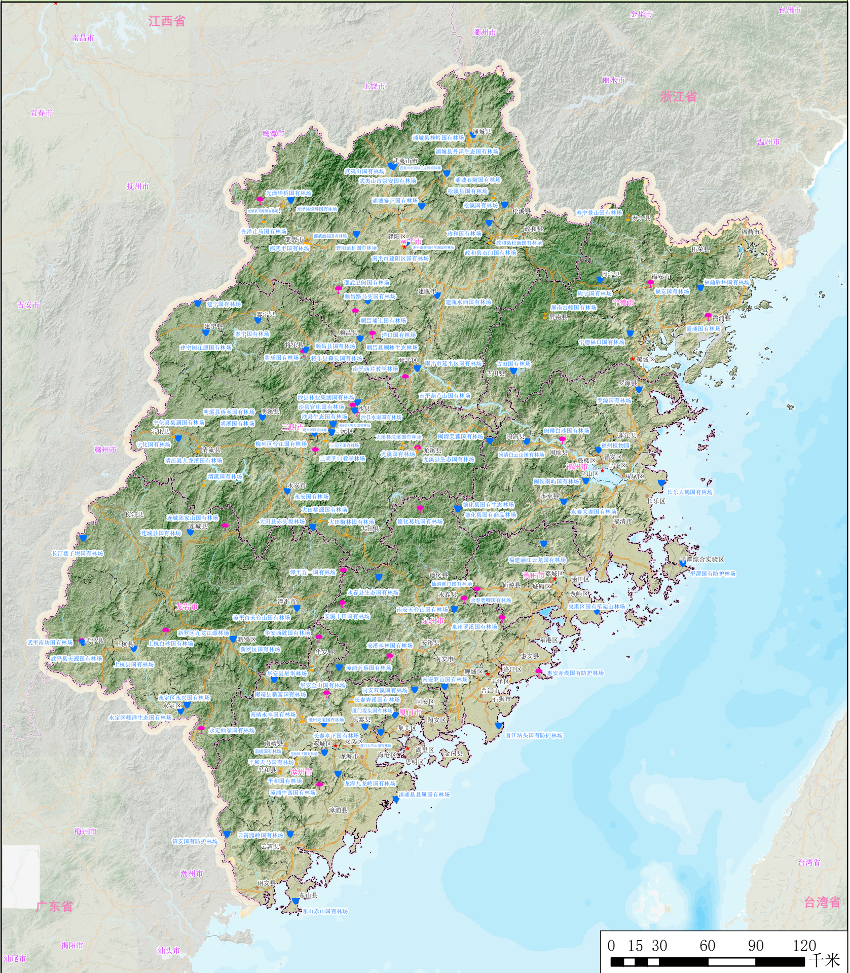
附图1 福建省国有林场发展分类布局图