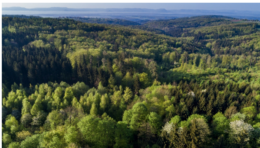
图 1 德国普法尔茨森林

德国是欧洲森林资源最丰富的国家之一，其森林总面积约 1150 万公顷，占国土的三分之一。德国法律明确要求森林同时实现经济生产、生态保护与社会服务三大功能。其林业人才的培养方向，也以复合型人才为导向：从业者不仅需要掌握现代技术、保障高效产出，也必须具备开展科学经营与生态维护的能力，同时还要承担森林游憩管理、公共服务等社会责任。