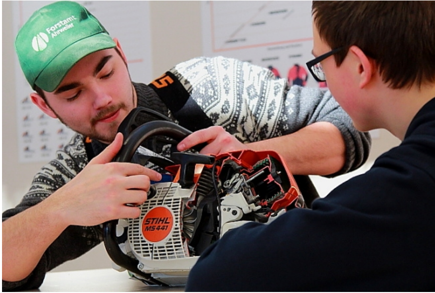
图 4 林务师跨企业培训现场（来源：莱茵兰-普法尔茨州国有林业局）

https://www.wald.rlp.de/forstamt-hachenburg-waldbildungszentrum/wir/waldbildungszentrum/ueberbetriebliche-forstwirtschaft-ausbildung#c25492