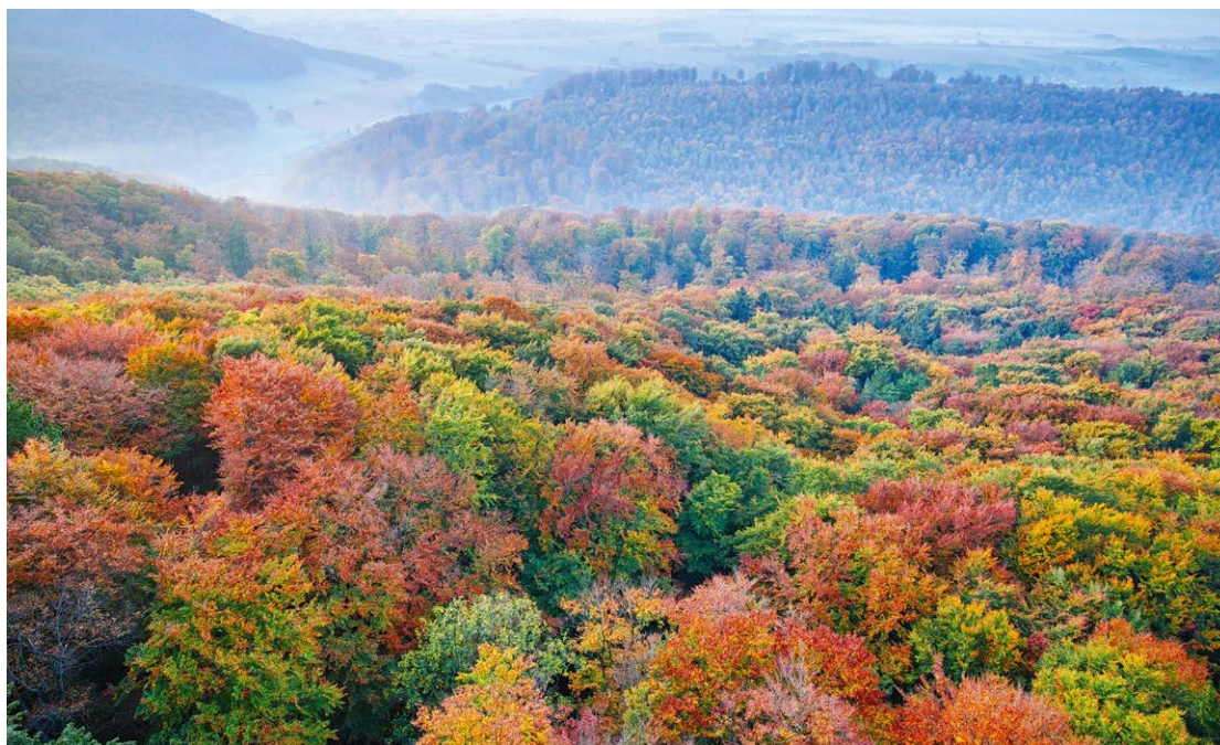
图 2 德国杜伊斯堡秋季的温带落叶阔叶林

https://www.bmluh.de/SharedDocs/Downloads/DE/Broschueren/vierte-bundeswaldinventur.pdf?__blob=publicationFile&v=17