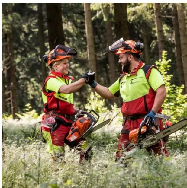
图 6 森林中手持油锯的男、女林务师

展望未来，面对数字化（如无人机监测）与生物多样性保护等行业新趋势，校企联动机制将推动新技能、新标准逐步纳入培训课程；随着林业机械化与智能化水平提升，林业相关岗位有望吸引女性等多元背景人才加入，持续优化行业人才结构。